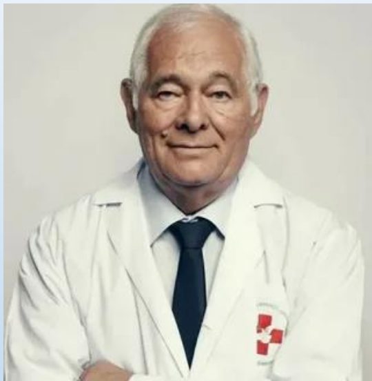
Леонид Рошаль, педиатр и хирург