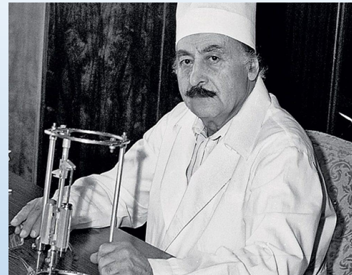
Гавриил Илизаров, хирург- ортопед, изобретатель