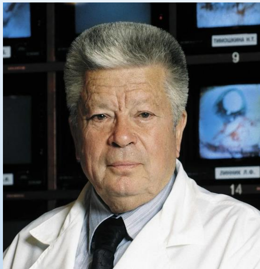
Святослав Фёдоров, офтальмолог